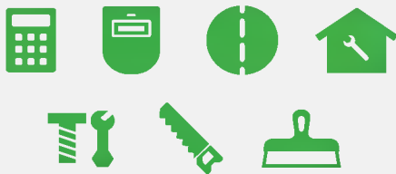
ГАПОУ «Камский строительный колледж имени Е.Н. Батенчука»