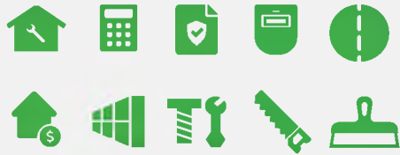
ГАПОУ «Казанский строительный колледж»